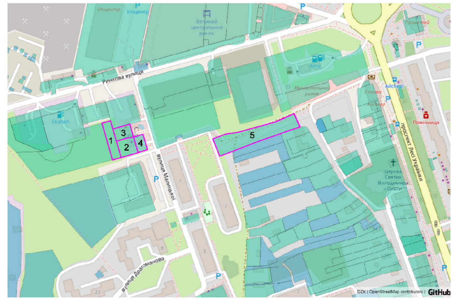
Схема розташування земельних ділянок згідно ДЗК